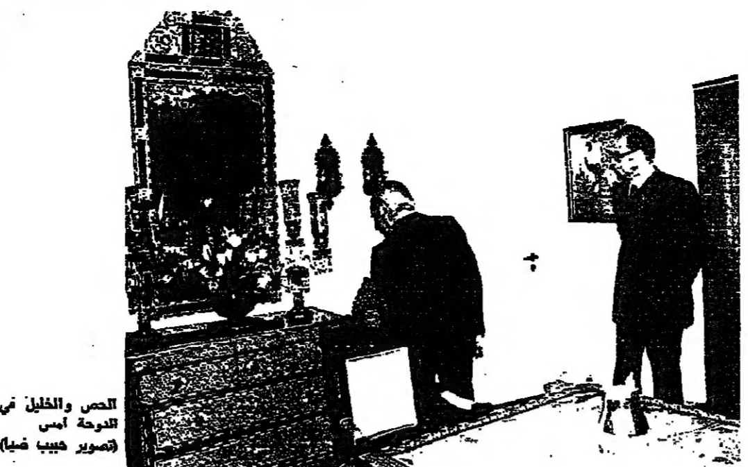
الحص والخليل في لحدوة امس

ويضم النائب لحدود يقول : ان وقف معظم الفرقاء اللبنانيين الى جانب سياسة الحوار من الصراع العربي القديم ، يعني ان هؤلاء جميعا استحووا على خندق واحد ، واصبحوا مركزين ان الوفاق اللبناني لم يعد يشتمل على التنازلات ، وهذا يشجعنا على ان نتوجه بندا الى جميع الفرقاء لنبينوا على حل قضية الجنوب ، وليسبحوا المقاتلين اللبنانيين من الجانبين . حتى اذا اردنا ان نرسل الجيش الى هناك ، كان